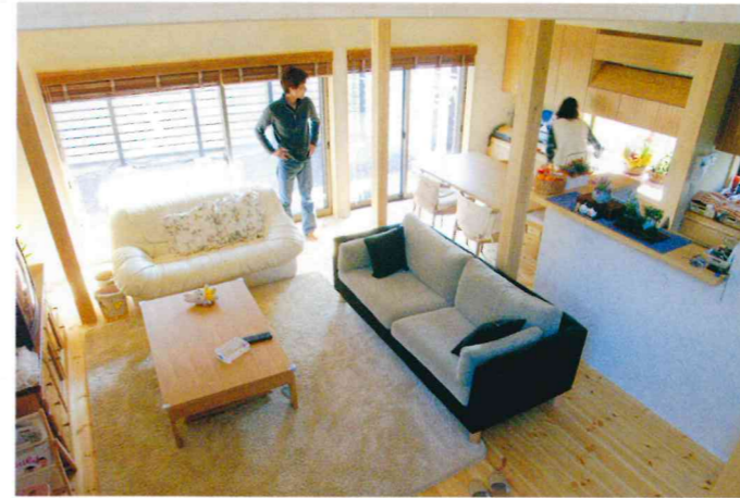
▲居間 階段部分から見る。柱、梁は、すべて富士山のヒノキ材。経済寸法でもある最大9寸の梁で対応できるよう、柱を1間（1.82メートル）間隔で列柱としてデザインしている。