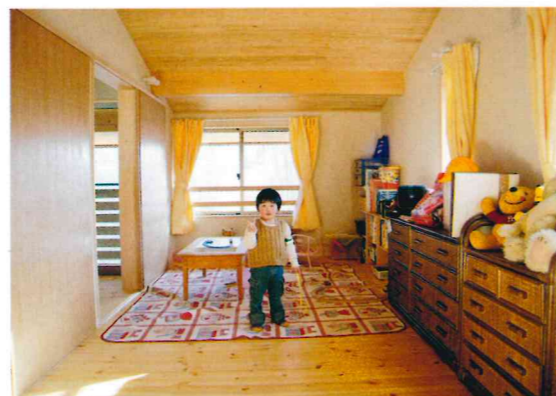
▲2階子供部屋 左側の廊下と吹き抜けを挟んで居間とつながっています。居間の雰囲気伝わります。