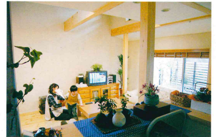
▲キッチンから居間を見る 小さな子供たちをいつでも見守れるように、対面型のキッチンを選択しました。また、家全体を仕切る司令塔になるよう、家の中心に配置するようにしました。