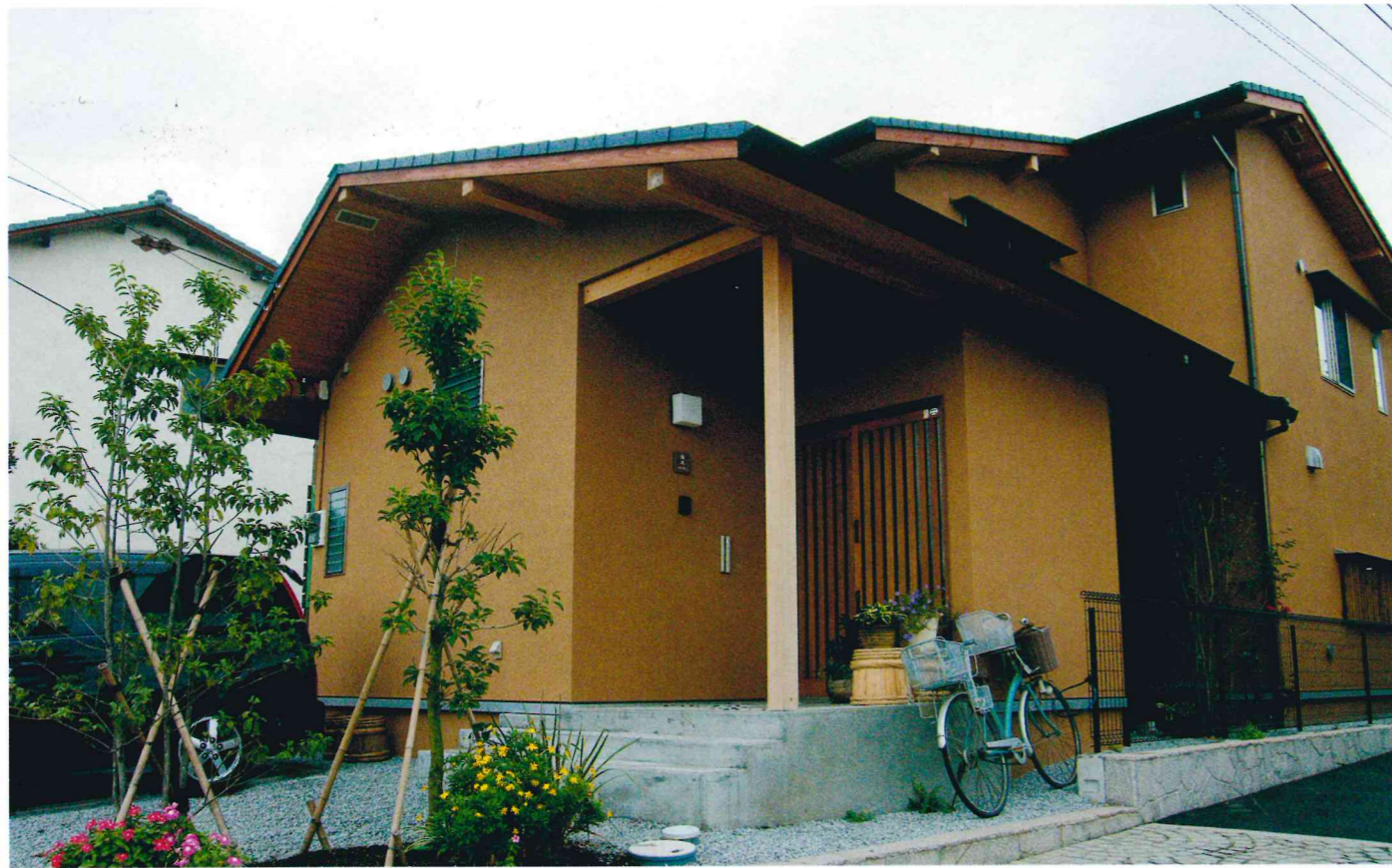
▲正面（北側）外観 道路に面した北側部分は、平屋とし、まちなみに圧迫感を与えない外観としました。南側には庭を確保しながら建物をセットバックして、東側のお隣への日照を妨げないように心掛け、室内に風や太陽光を採りこむようにしています。