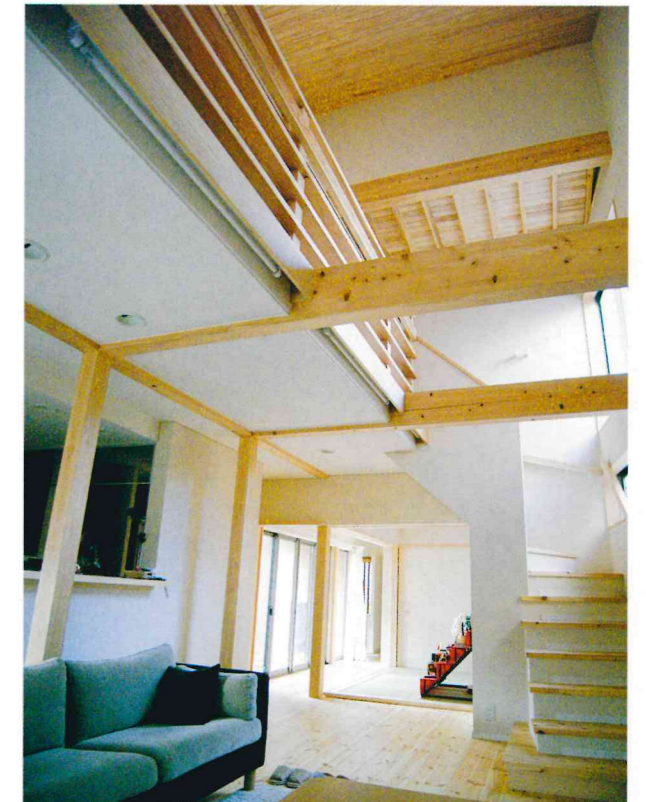
▲居間上部吹き抜け 吹き抜け西側が子供部屋。北側が寝室。2階の部屋とも一つの空間、家族の気配が感じられるよう吹き抜けを配置しました。