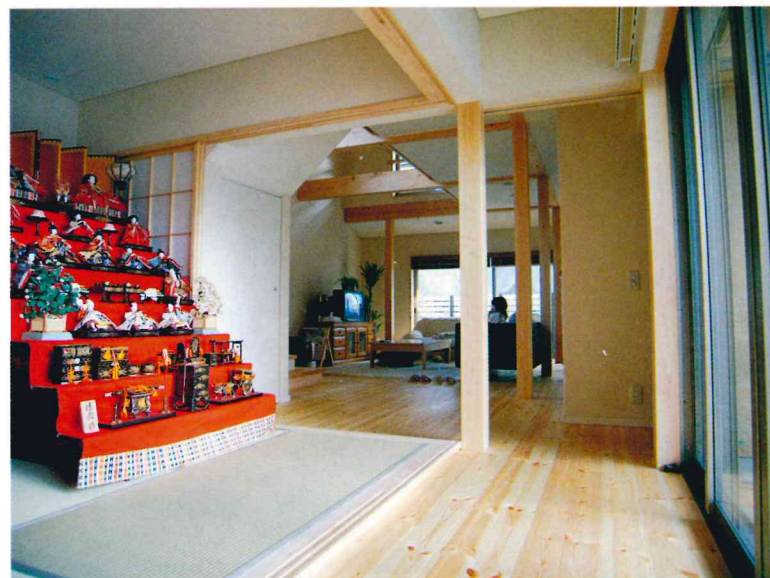
▲玄関入ってすぐの、中庭に面した和室 唯一の和室です。引き込み戸や小さな中庭に面しているため、季節の祭事や客間、日々のごろ寝の場など、いろいろな利用がなされています。